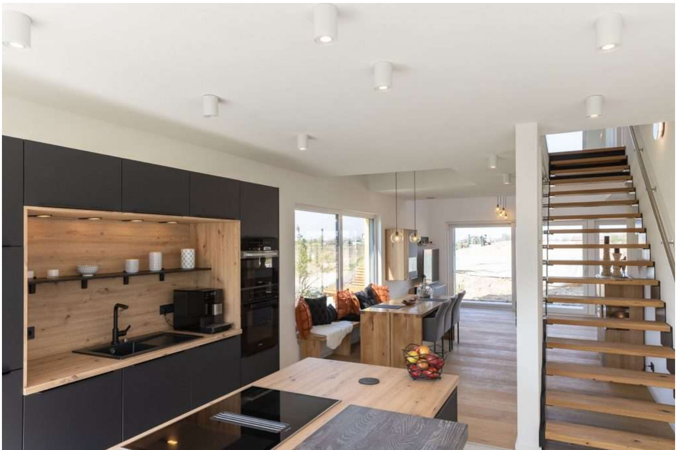
Referenz Beispiel Wohnzimmer