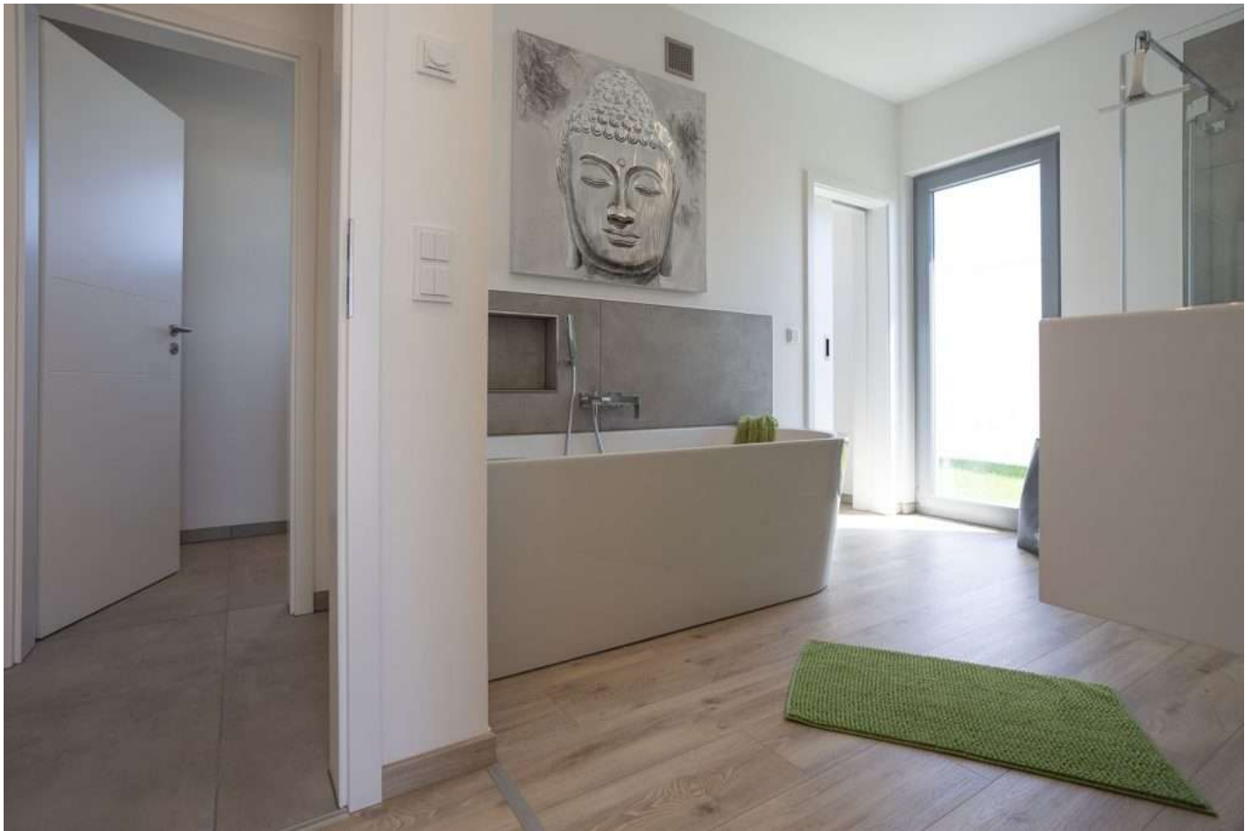
Referenz Beispiel Bad