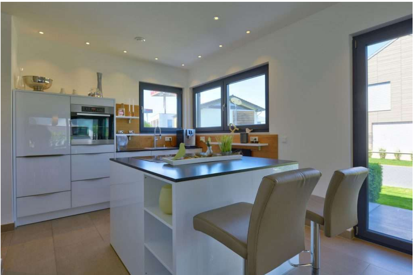
Referenz Beispiel Küche