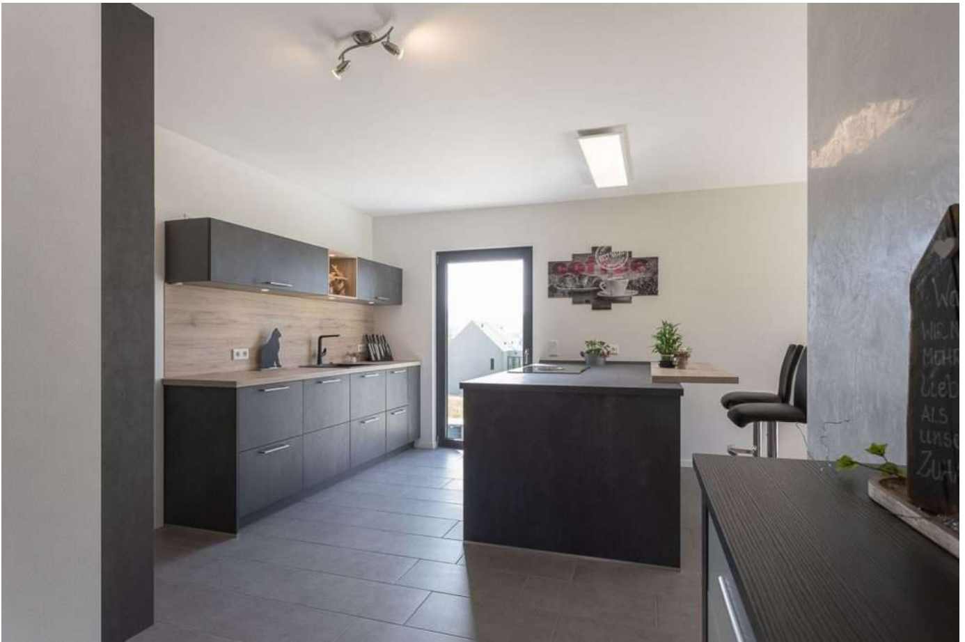
Referenz Beispiel Küche