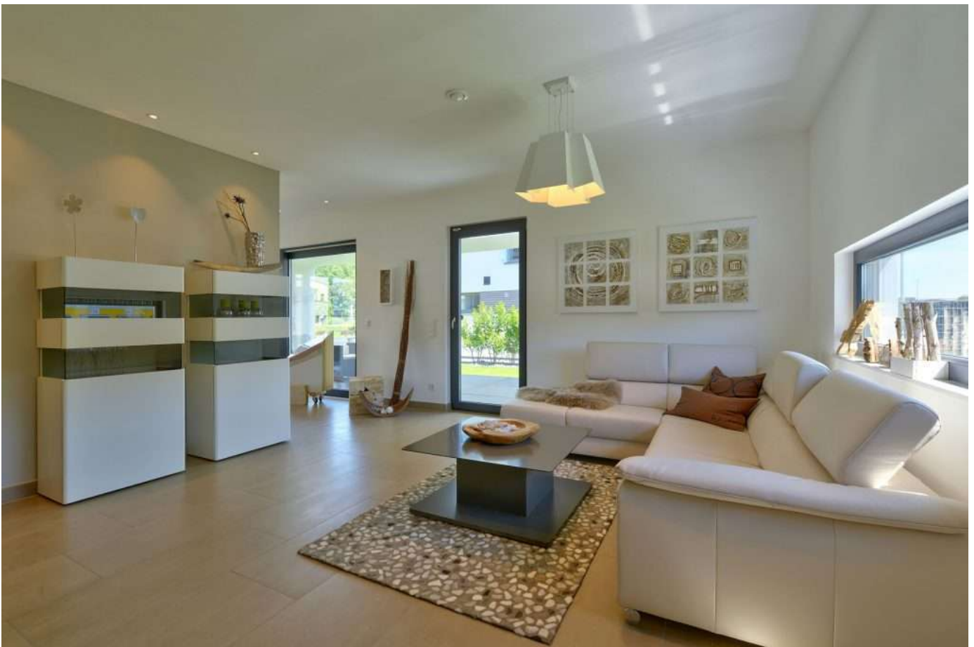
Referenz Beispiel Wohnzimmer