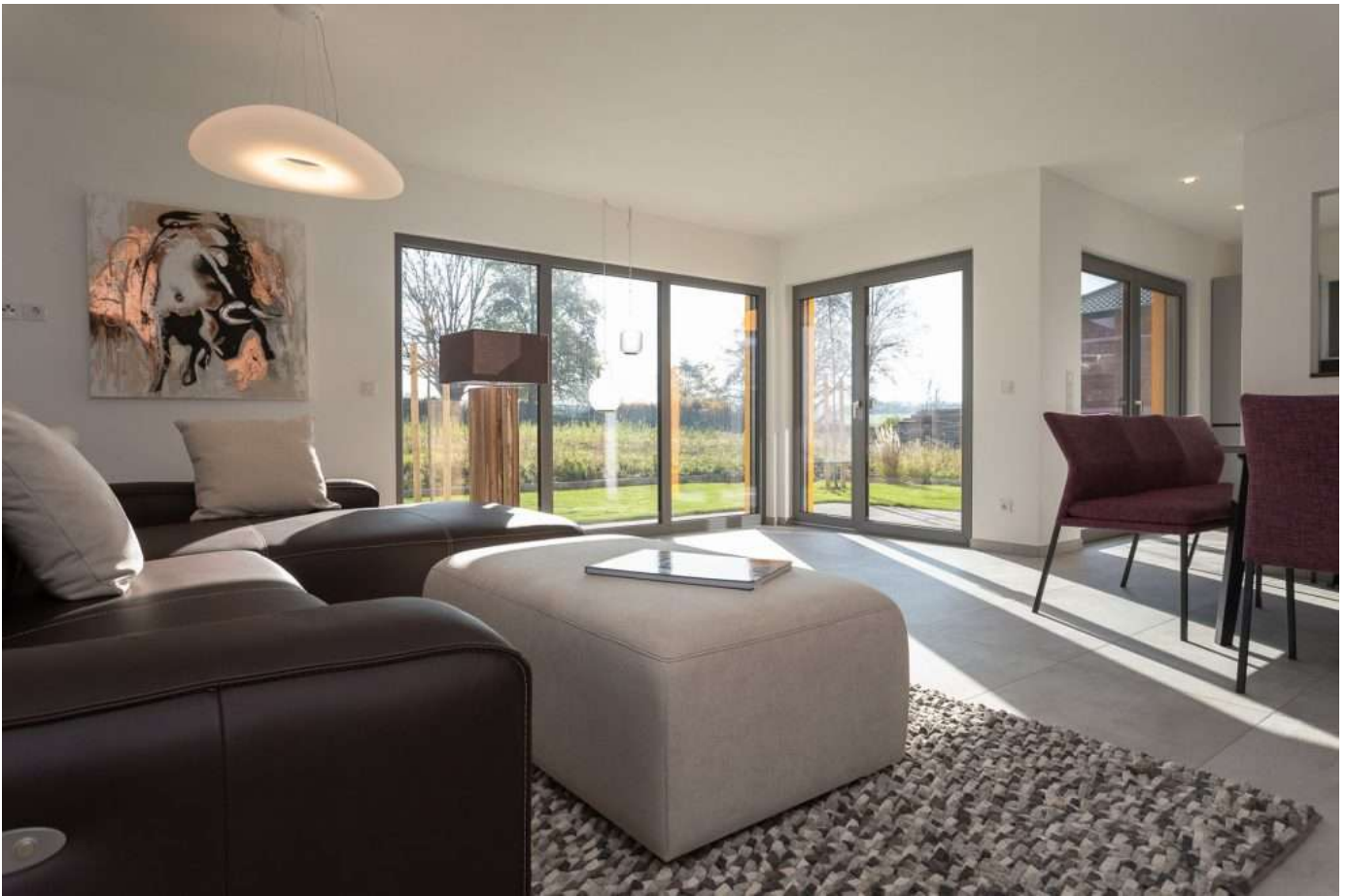
Referenz Beispiel Wohnzimmer